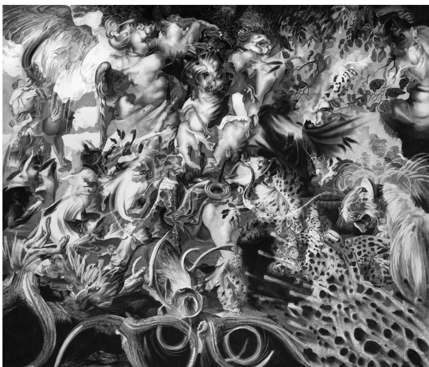
Tudi Deligne, Dispute avec Pier Paul Rubens 3 - Le couronnement de Diane, 2022 . Fusain sur papier, 127 x 112 cm